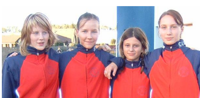
Starší žákyně 4x60 m